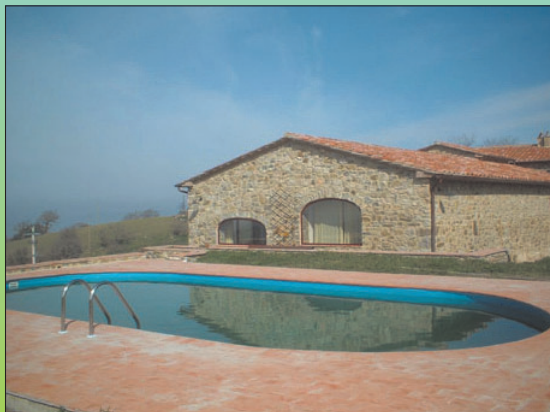
layout © 2012 - helmut vizedum, utting